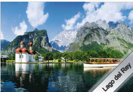
Lago del Rey